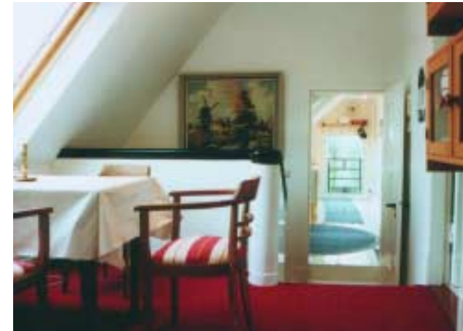
Essecke im Obergeschoss, mit Durchblick zur Küche

Im Wohnzimmer unten finden Sie Bücher, Spiele, Fernseher, Musikschrank und an der Wand u.a. eine große Ostfrieslandkarte mit markierten attraktiven Ausflugszielen, die auf einer zweiten Karte im Flur erläutert werden.