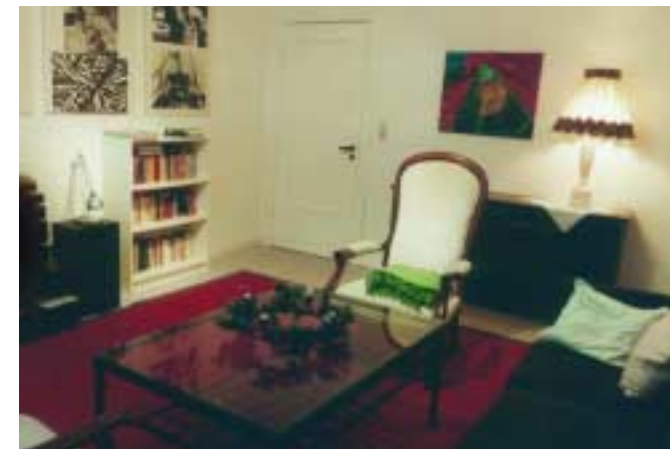
Das Wohn-Schlafzimmer im Obergeschoss

Abendsonne und Sonnenuntergang sind am schönsten auf dem Deich zu sehen, aber auch die Essecke und das Wohnzimmer im Obergeschoss bieten diesen Genuss. – Der Blick durchs große Küchenfenster geht in den Garten.