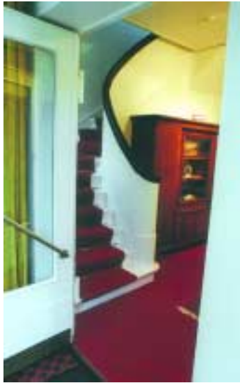
Der Eingang zum Obergeschoss mit Blick auf die Treppe nach oben

Das Haus hat den Charme eines alten Hauses mit vielen schönen handwerklichen Details behalten.