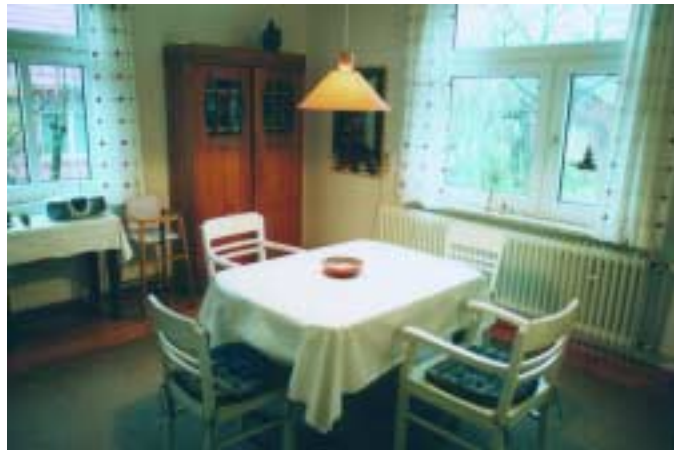
Die Wohnküche im Erdgeschoss