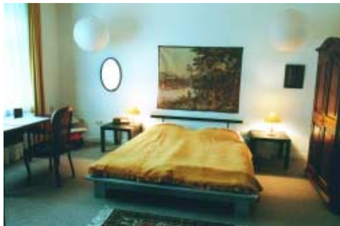
Zweites Wohn-Schlafzimmer im Erdgeschoss