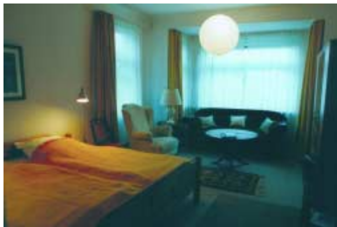
Erstes Wohn-Schlafzimmer im Erdgeschoss