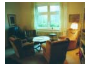
Das Wohnzimmer im Erdgeschoss

Im Wohnzimmer unten finden Sie Bücher, Spiele, Fernseher, Musikschrank und an der Wand u.a. eine große Ostfrieslandkarte mit markierten attraktiven Ausflugszielen, die auf einer zweiten Karte im Flur erläutert werden.